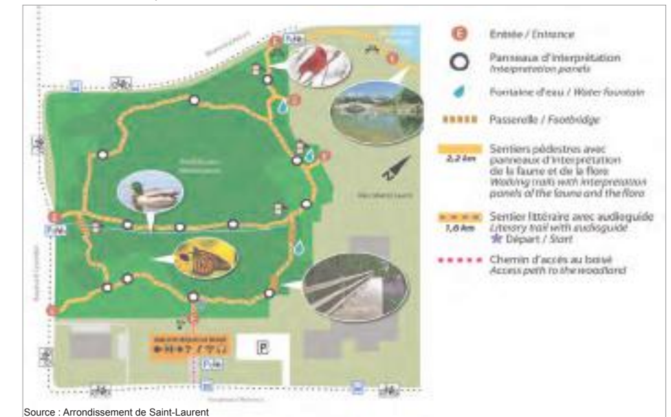
Sentier du Boisé du parc Marcel-Laurin