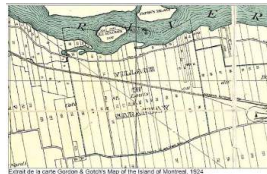
Extrait de la carte Gordon & Gotch's Map of the Island of Montreal, 1924